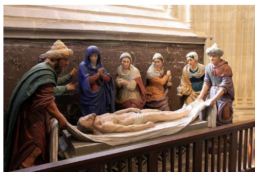
Cathédrale St Corentin-Quimper

Evangile selon st Luc : « C'était le jour de la Préparation de la fête, et déjà brillèrent les lumières du sabbat. Les femmes qui avaient accompagné Jésus depuis la Galilée suivirent Joseph. Elles regardèrent le tombeau pour voir comment le corps avait été placé. Puis elles s'en retournèrent et préparèrent aromates et parfums. Et, durant le sabbat, elles observèrent le repos prescrit. »